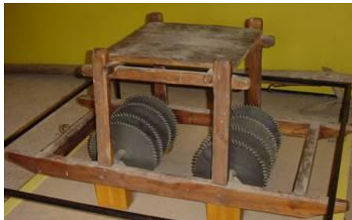
Foto 3 "Dorsmachine" voorzien van gekartelde schijven.

Na het dorsen was het wannen aan de beurt. Met een schop of een houten vork werd het stro in de wind in omhoog geworpen. Het stro en het kaf, die lichter zijn als de graankorrels, waait een eindje verderop een hoop, terwijl de zwaardere graankorrels naar beneden vallen. Op die manier, werd het stro en het kaf van het koren gescheiden.