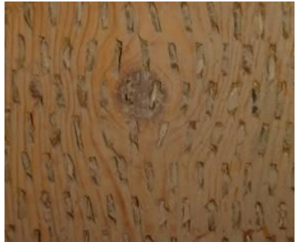
Foto 2. Duidelijk zijn de versleten steentjes in het vergrootte deel van de dorsslede te zien