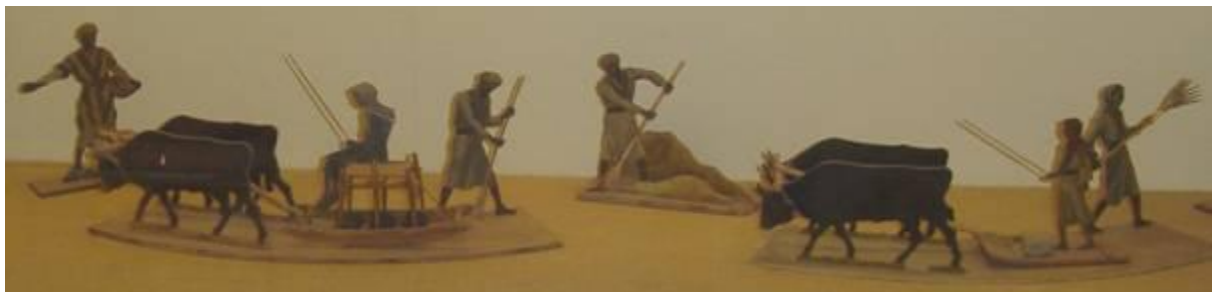
Maquette in het Museumpark Orientalis. 2 manieren van dorsen

Door deze manier van dorsen werd niet alleen het graan uit de halmen verwijderd, maar ook werd het stro in kleine stukjes gebroken. Dat kon dan als voer voor het vee en de kamelen dienen. Het werd dan vermengd met gerst.